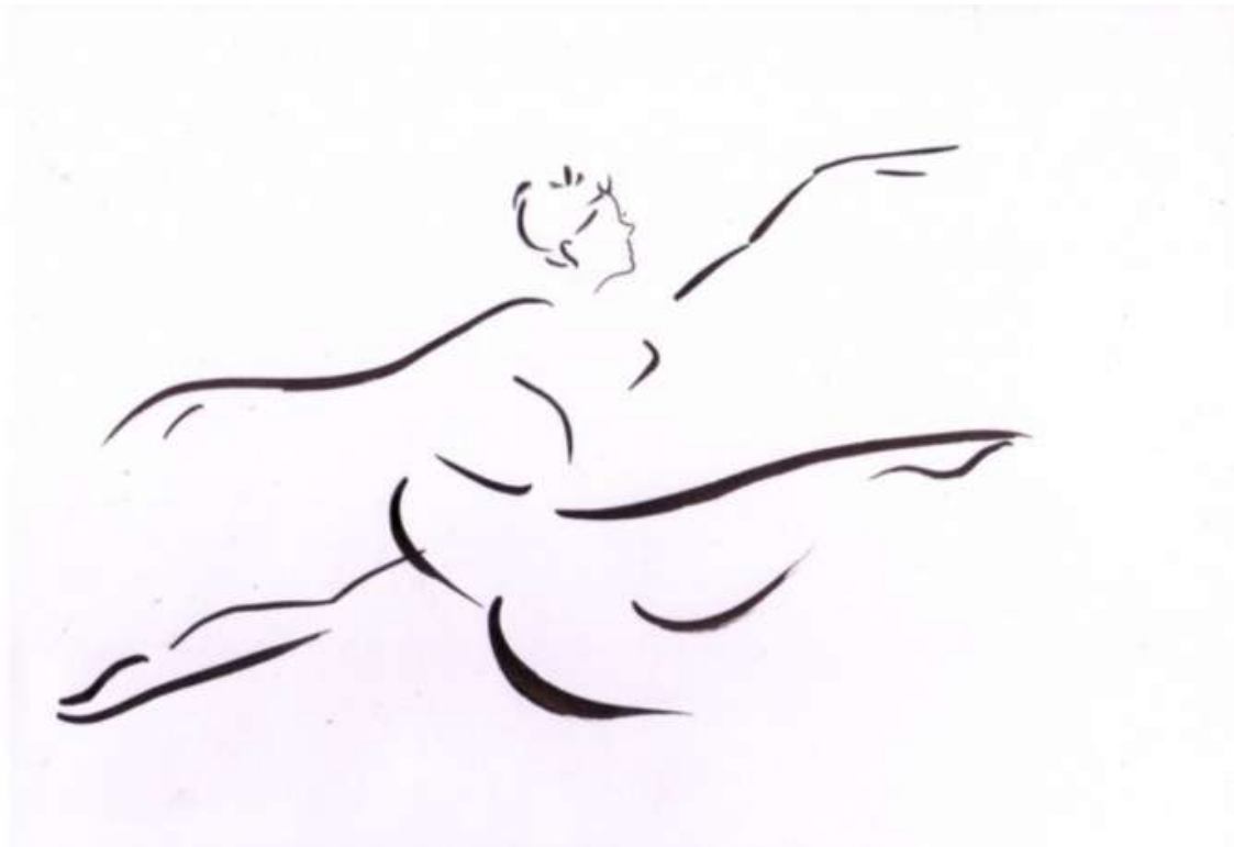
Beini XU, Prix Nobel de la paix

Parviendront-elles à rester assez libres pour échapper à la séduction des agendas politiques, en inaugurant un nouveau régime de coexistence et en participant à leur façon, à l'émergence de modes d'interactions humaines propices à la gestion durable de notre monde ?