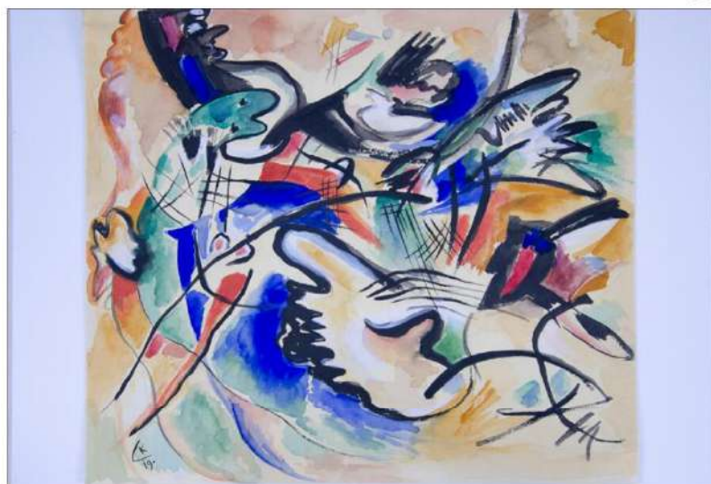
Cette gouache de Kandinsky de 1919 jamais exposée, qui appartient à un collectionneur privé, sera exceptionnellement montrée au Palais épiscopal.

Pour ce très grand spécialiste de Kandinsky, ces années charnières, à Munich et Murnau, celles du Cavalier bleu entre autres groupes, sont particulièrement